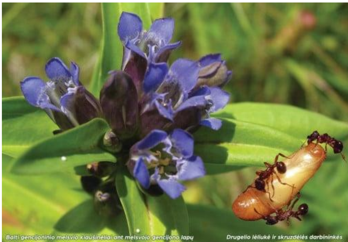
4 pav. Melsvasis gencijonas ir drugelio lėliukę nešančios skruzdėlės darbininkės (koliažo autorius Dzūkijos-Suvalkijos saugomų teritorijų direkcija)