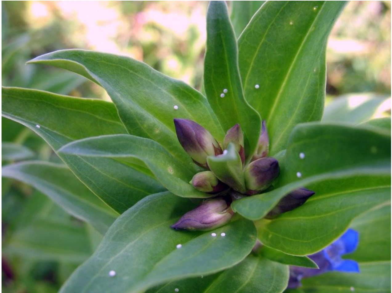
2 pav. Ant melsvojo gencijono lapų padėti balti gencijoninio melsvio kiaušinėliai