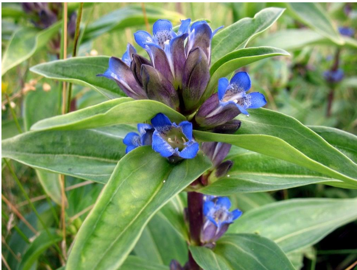
1 pav. Melsvasis gencijonas ( Gentiana cruciata L.)

Keletas nuotraukų, kuriose užfiksuotas melsvasis gencijonas ir gencijoninis melsvys: